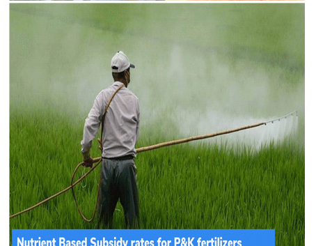
Nutrient Based Subsidy rates for P&K fertilizers

(A) केंद्र सरकार ने घोषणा की कि इस साल के खरीफ सीजन के लिए फॉस्फेटिक और पोटाश उर्वरकों के लिए पोषक तत्व आधारित सब्सिडी की दर वर्ष 2021 के लिए 57,150 करोड़ रुपये के मुकाबले, अप्रैल से सितंबर 2022 तक बढ़ाकर 60,939 करोड़ रुपये कर दी जाएगी।